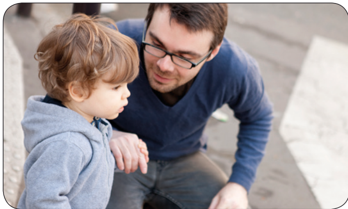
Gjuha e më hershme · 3-6vj

Fëmijët në mes moshës 3-6 vj. nuk thonë vetë edhe pse nuk kuptojnë. Së pari aty rreth moshës 5 vj. fillojnë të kuptojnë e të pyesin për ate që se kuptojnë.